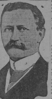
DAVID R. FRANCIS

WASHINGTON, 18.—Cap. Sims, Commander of the armored cruiser "Nevada" who was present at the Naval Commission of the Senate, made an exclamation favoring the immediate starting in the building of eight or nine armored fighting cruisers, urgently needed by the American fleet.